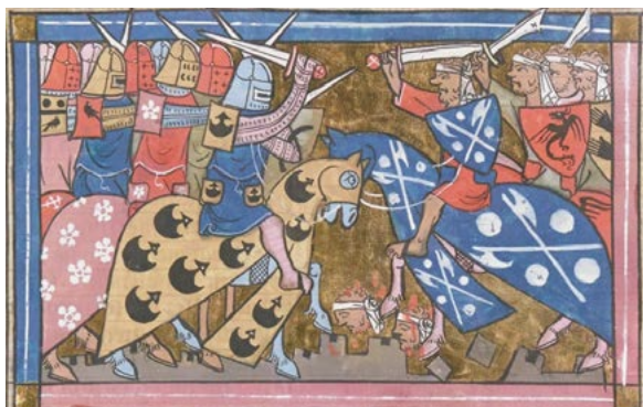
Kreuzzüge unterlagen der Logik des „bellum iustum“.

Für ChristInnen ist Friede nicht bloß Abwesenheit von Krieg, sondern Ausdruck einer inneren und äußeren Haltung, die auf Liebe, Gerechtigkeit, Barmherzigkeit und Wahrheit gründet. Damit ist Friede zugleich Ziel und Weg christlichen Lebens.