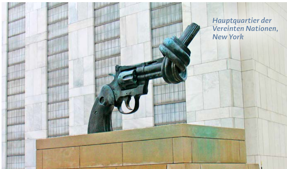
Hauptquartier der Vereinten Nationen, New York

Das Konzept dieses Heftes kann einen Beitrag leisten zu einer theologisch begründeten Friedensethik, die auf die unterschiedlichsten Konflikte anwendbar ist.